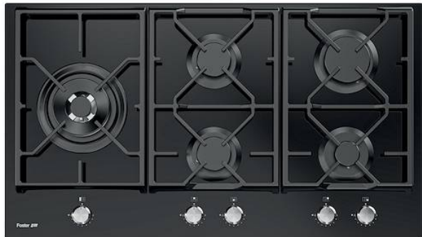
Table de cuisson Power Glass